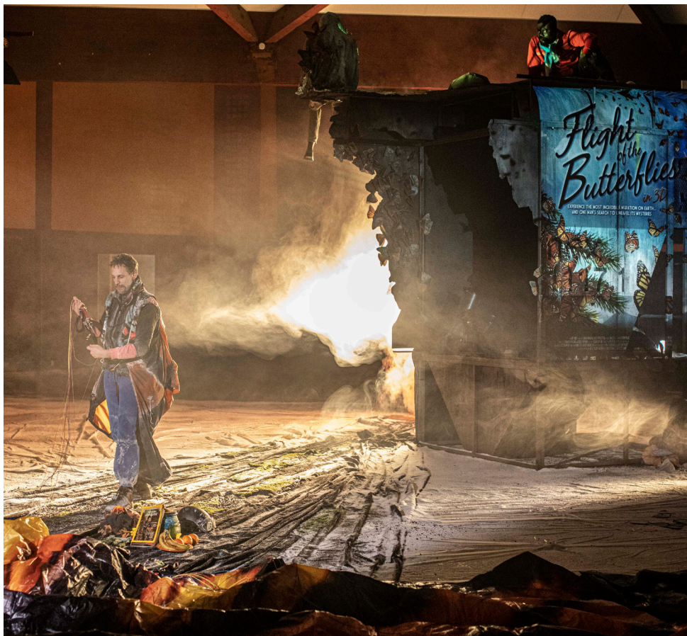
Sur l'aile d'un papillon