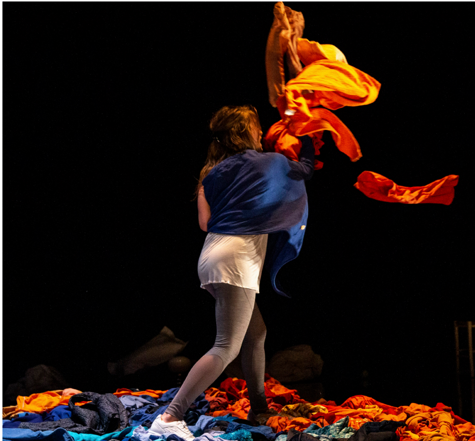
Petite Iliade en un souffle