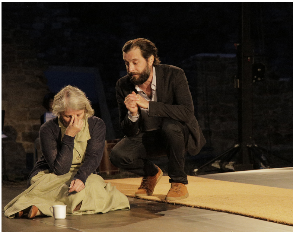
Juste la fin du monde