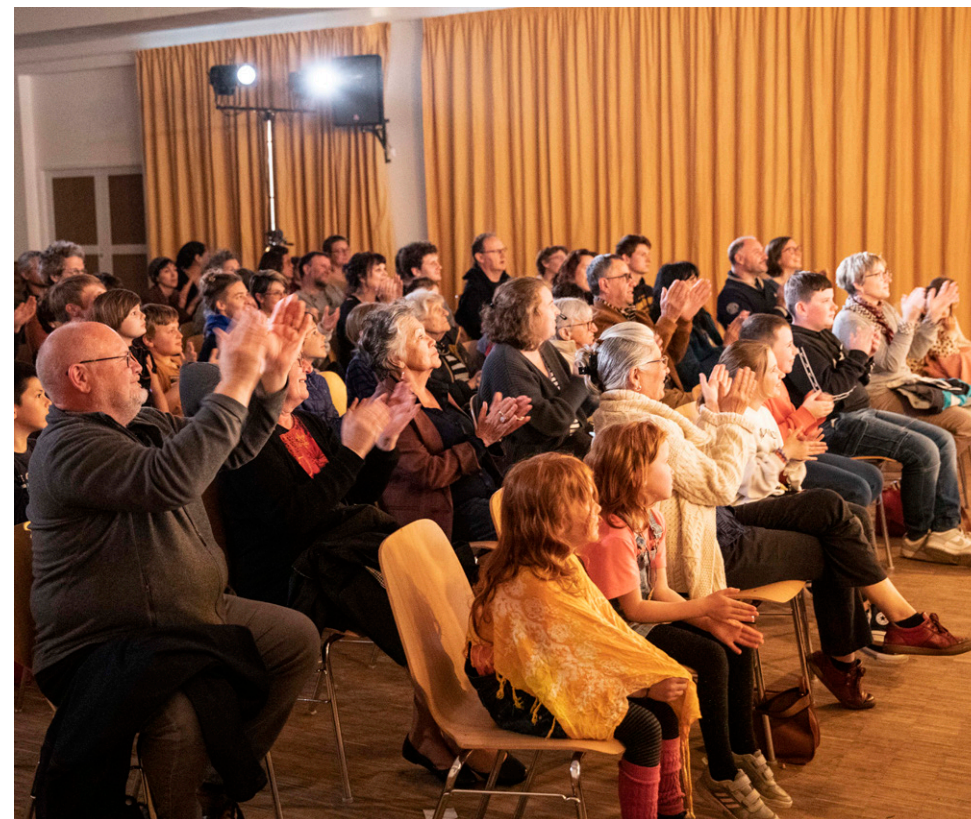
Itinérance, saison 23-24, Petite Iliade en un souffle , salle des fêtes de Langonnet (56)