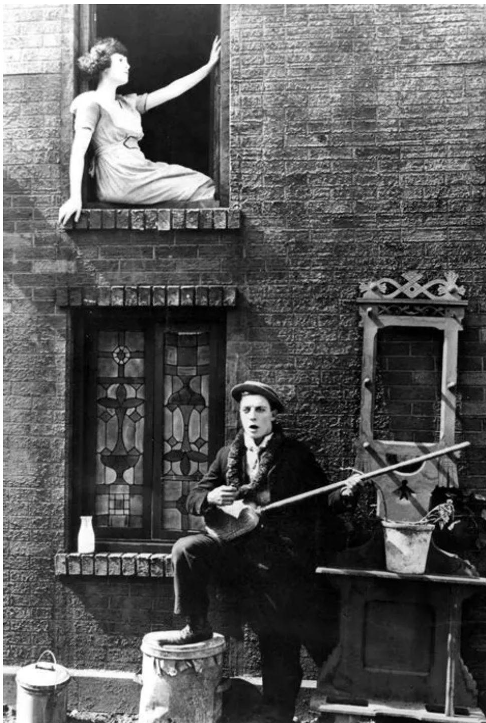
22 • PRODUCTIONS ET TOURNÉES • 24-25-26