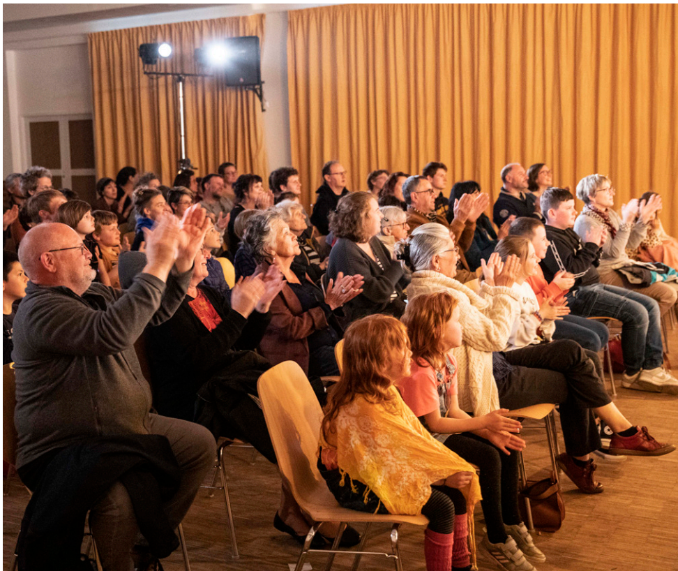
Itinérance, saison 23-24, Petite Iliade en un souffle , salle des fêtes de Langonnet (56)