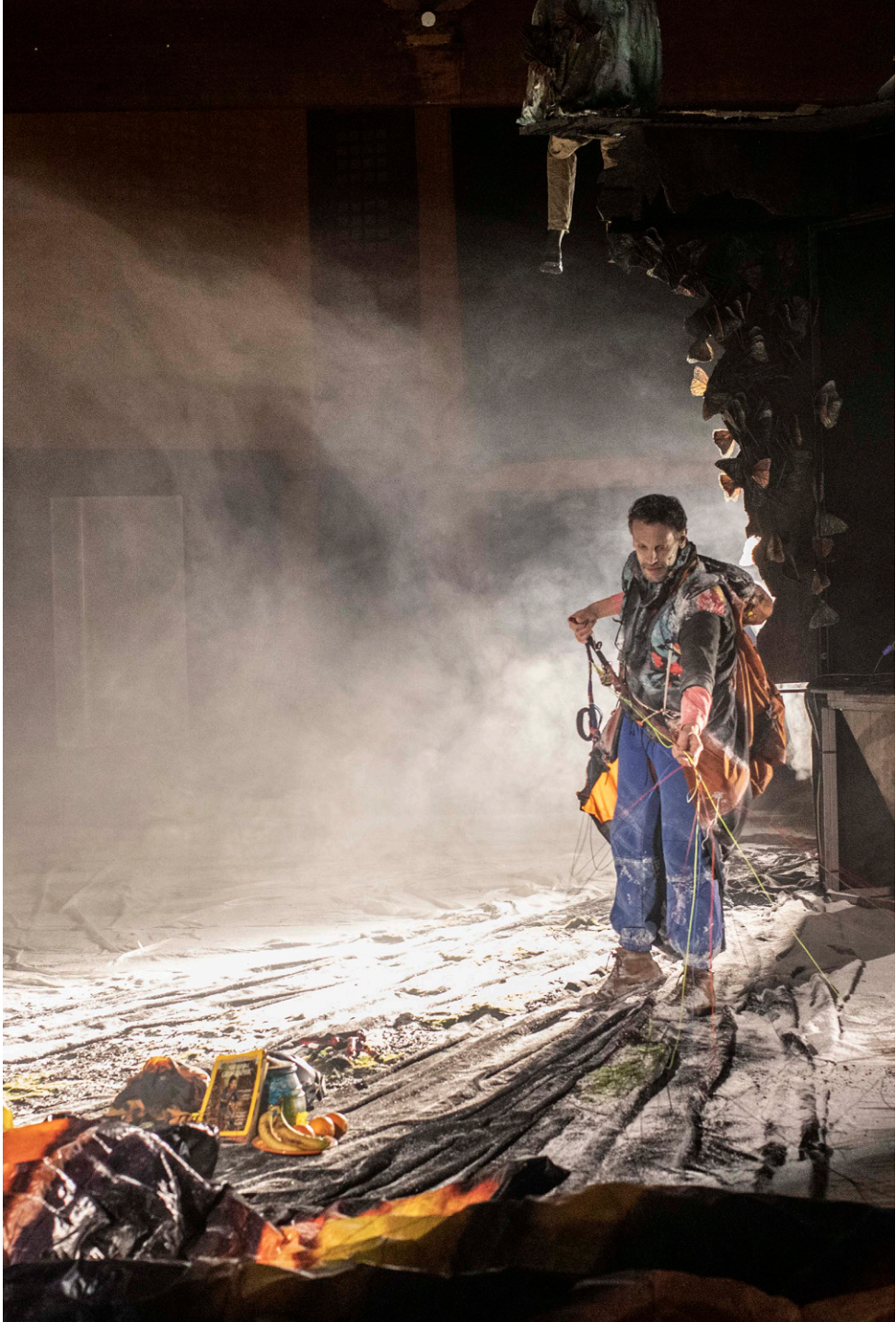
6 • ITINÉRANCE • 24-25