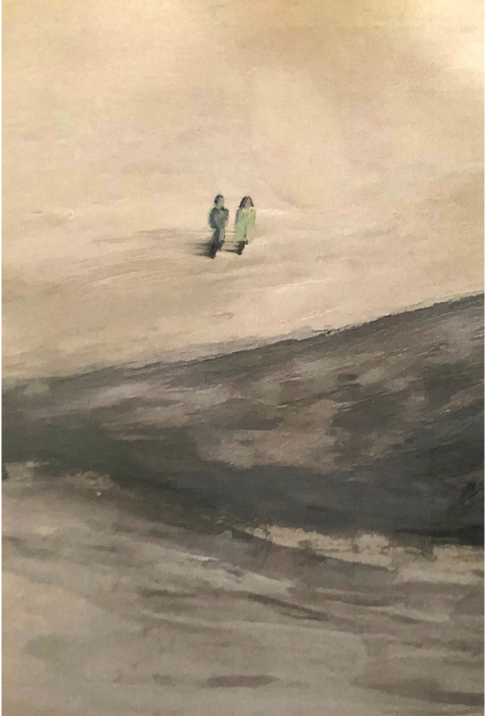
10 • ITINÉRANCE • 24-25