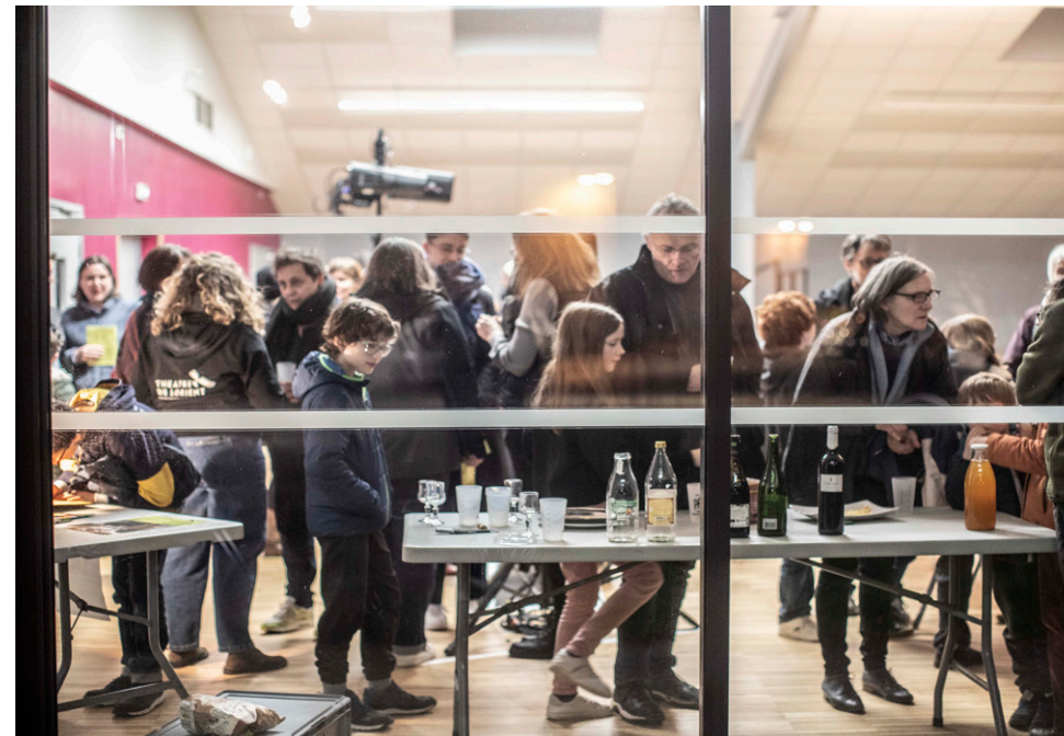
Itinérance, saison 24-25, Grandir , Salle Ty Fest, Saint-Barthélémy (56)